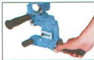
グリップを回しダイを90° 倒す