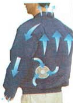
空気の流れのイメージ

ファンから服の中に毎秒20リットルの外気が取り込まれます。取り込まれた空気は、服と体の間を平行に流れ、その過程でかいた汗を気化させます。体は気化熱を奪われて冷え、服の中を通った暖かく湿った空気は襟元と袖口から排出されます。