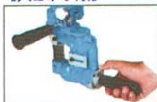
レバーを引きロックを解除